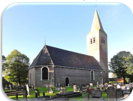
De huidige kerk

Al in 1245 wordt er gesproken van een parochiekerkje in Harich,